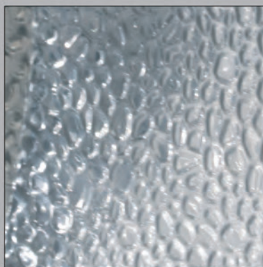
Reflector de aluminio anodizado, abriantado y martillado.